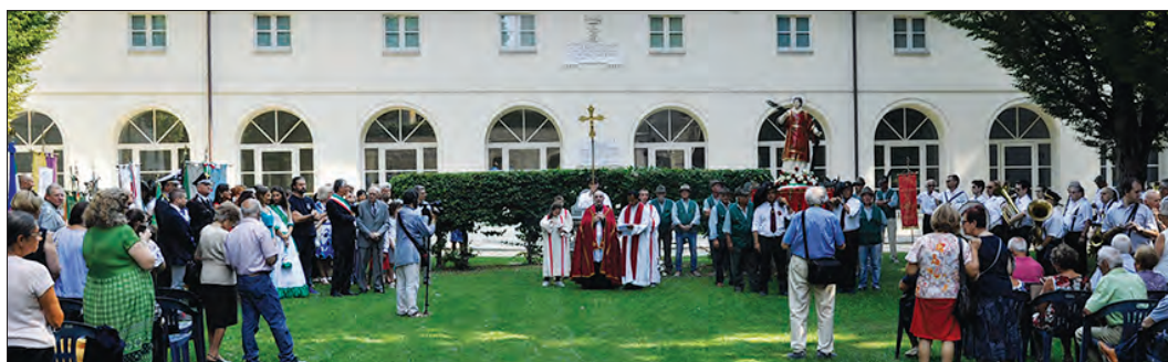
Termine della processione a San Lorenzo nel Parco Cavour davanti alle scuderie