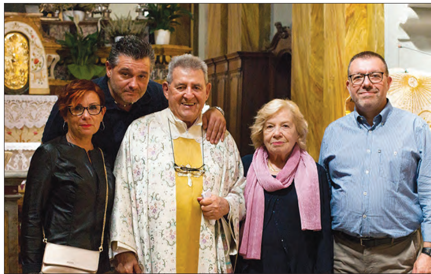
Padre Navone insieme ai suoi famigliari