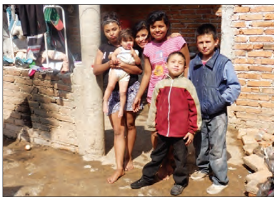
Una delle famiglie che assistiamo