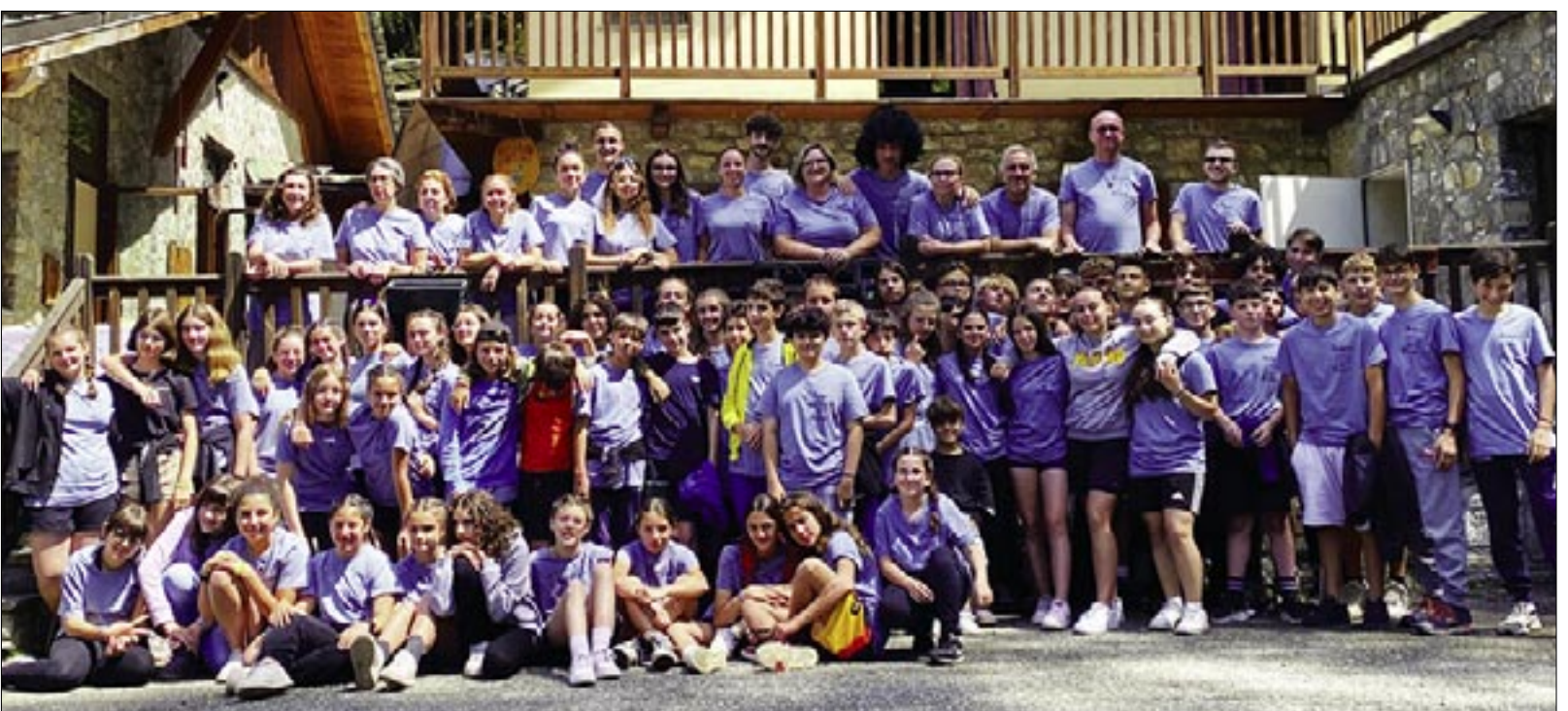
Gruppo del secondo turno, medie