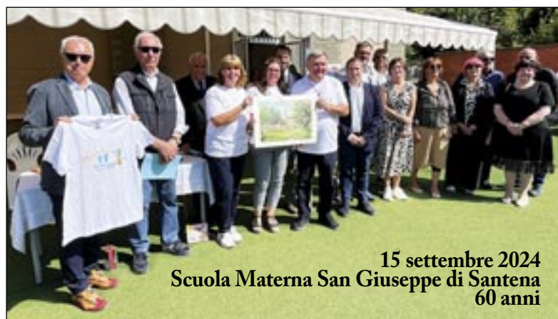
15 settembre 2024 Scuola Materna San Giuseppe di Santena 60 anni