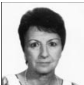
Villa Margherita in Gariglio