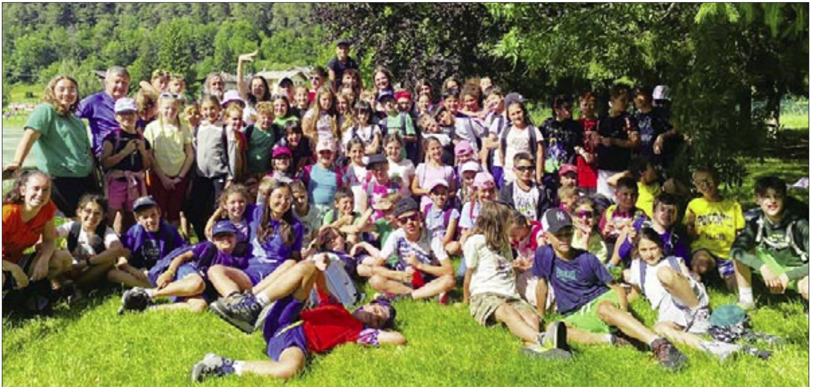
Gruppo del primo turno, elementari

Anche per gli animatori, cuochi e preti sono stati giorni belli e arricchenti, nonostante la fatica. I campi erano rivolti a bambini e ragazzi fino ai 18 anni, ma anche per i più grandi c'è stato una specie di mini campo: abbiamo fatto un bel weekend in montagna, alla Conca del Prà , sopra Bobbio Pellice , soggiornando in un